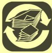
CARTA e CARTONE