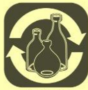
VETRO e ALLUMINIO