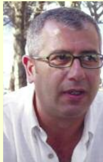
Il regista Enzo Toto

Tiezzi. Uno spettacolo che parla dell'epoca fascista, ma dai risvolti molto contemporanei.