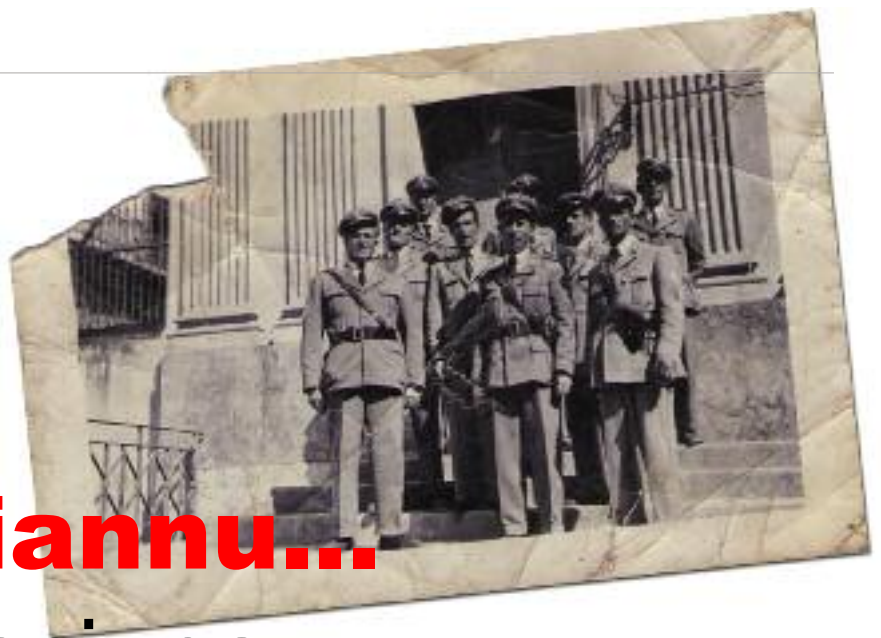
Foto ingiallite, sbianchiduti, cunsunti, che portano tutto il peso del tempo trascorso. Una quantità impressionante di ricordi, rievocazioni della memoria, sentimenti, nostalgia per un tempo passato, che ssà ca 'un arritorna mai cchiù.