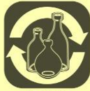
VETRO e ALLUMINIO