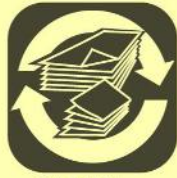
CARTA e CARTONE